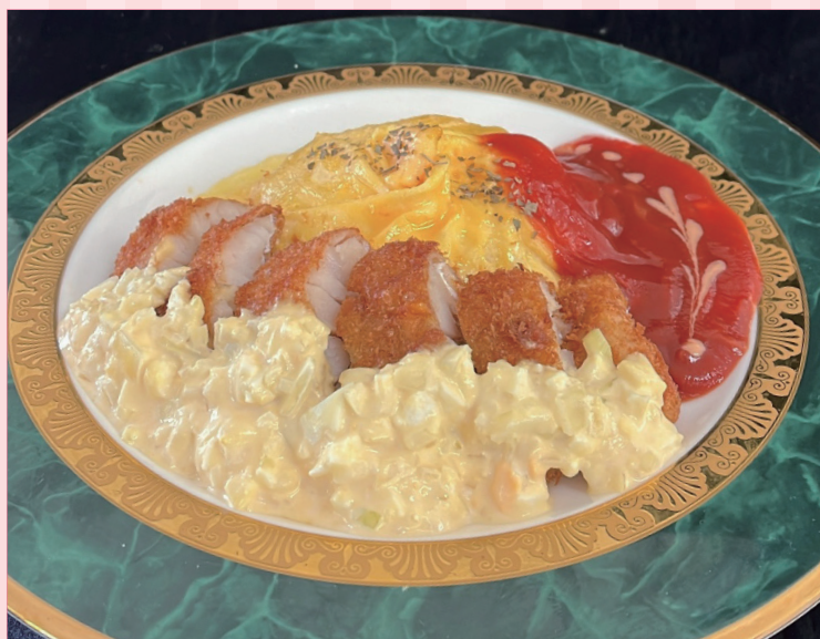
甘鯛のハントンライス

このコンクールは、「魚活チャレンジ部門」「プロを目指す学生部門」合わせて約2,542件の応募があった中、書類選考を通過した16名が全国から参加。本校の学生は、山口県を代表する魚である「アマダイ」を使った「甘鯛のハントンライス」で出場しました!