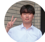
公務員総合学科 1年 (防府商工高等学校 出身)

8月1日(火)~3日(木)の3日間で、山口市役所小郡総合支所でのインターンシップに参加しました。農家さんと主に関わりのある農林課や、建設中の道路などの工事現場の視察をする土木課など、あまり目にする機会はありませんが、市民生活に役立つことができる仕事があることを学びました。インターンシップの中で、職員の方が「自分の仕事が市民の役に立っていることにやりがいを感じる」とおっしゃっていたのが印象的でした。とても貴重な経験となりました。