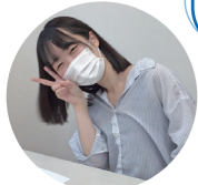
医療事務学科 2年 (津和野高等学校 出身)

医療事務学科では、1年生の時から電話対応の授業があります。日々の成果を発揮することができ、うれしいです。9月の山口県支部大会に向けて精一杯がんばります!