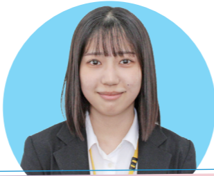
公務員総合学科 宇部中央高等学校出身

私は将来、学校事務員になりたいと考えています。その目標を実現するために、YIC に入学しました。はじめは自分が勉強についていけないか不安でしたが、周りの友人や先生方が丁寧に教えてくださるので、前向きに取り組んでいます。私は2年制の学科ですが、1年間で公務員試験に合格する気持ちで今からしっかり勉強に励みたいと思います。