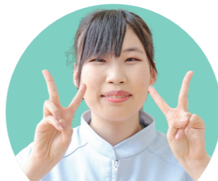
作業療法学科 防府西高等学校出身

入学前は新しく始まる勉強に不安を感じていましたが、全体的にグループワークの授業が多く、さまざまな視点や考え方が共有でき、授業内容の濃さを実感しています。骨や筋の名称を覚えることが大変ですが、友人とお互いの体で骨や筋を確認し合いながら楽しく学んでいます。4年後の国家試験を合格できるように仲間と共に努力していきます。