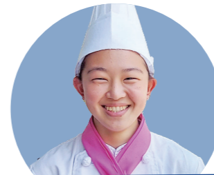
調理師科1年コース 折尾愛真高等学校出身

私は卒業後、介護施設などで集団給食に関わり、調理の力をつけたいと思っています。その先は、自分のお店を持ちたいと思っています。今、包丁の使い方などの基礎的な技術を磨いています。みじん切りなどを早く上手に仕上げられるようになりたいです。1年間はあっという間だと思うので時間を大切に一生懸命学んでいます。