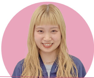
美容学科 宇部中央高等学校出身

将来の夢はたくさんの人を笑顔にできる美容師になることです。自分のカット技術でお客様が自信を持ち、新しい一歩を踏み出すきっかけを作れるようになりたいです。毎日、実習に、座学にと大変ですが、夢を叶えるために、まずは美容師国家試験取得をめざしてがんばります。