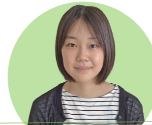
介護福祉学科 山口県鴻城高等学校出身

私は中学生の時に、母が介護の仕事をしている姿を見て介護福祉士をめざそうと思い、本校に入学しました。学校では介護の技術や知識を学び、充実した学校生活を送っています。たくさんの高齢者の方を笑顔にできる介護福祉士をめざし、日々仲間と切磋琢磨してがんばっています。