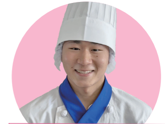
調理師科1年コース 光高等学校出身

私はホテルに就職し、自分の作った料理でお客様を笑顔にしたいという夢があります。そのために日ごろから実技の練習を重ね、包丁と仲良くなり、料理の腕を上げたいと思っています。将来の夢の実現に向けて一生懸命がんばります！